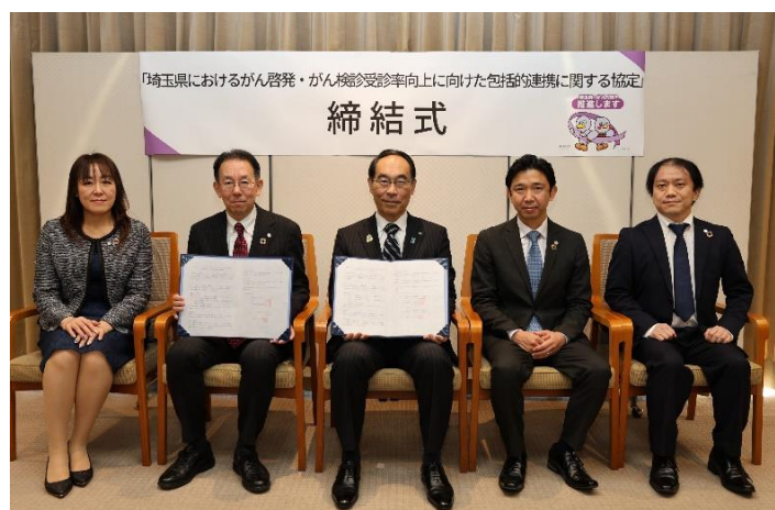
ユナイテッド・インシュアランス株式会社